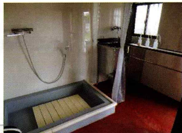
大型犬用洗い場と 小・中型犬用ドッグバス (奥)