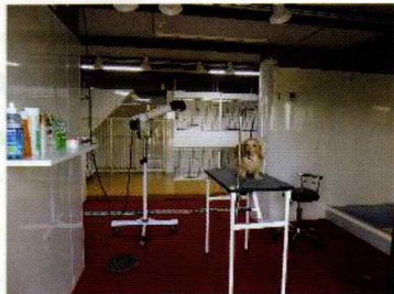
セルフ トリミングスペース